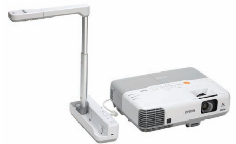
3D-Objekte einfach präsentieren mit der Dokumentenkamera Epson ELP-DC06