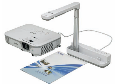
Fotokopien überflüssig: Dokumente und 3D-Objekte lassen sich über die optionale Dokumentenkamera Epson ELP-DC06 projizieren