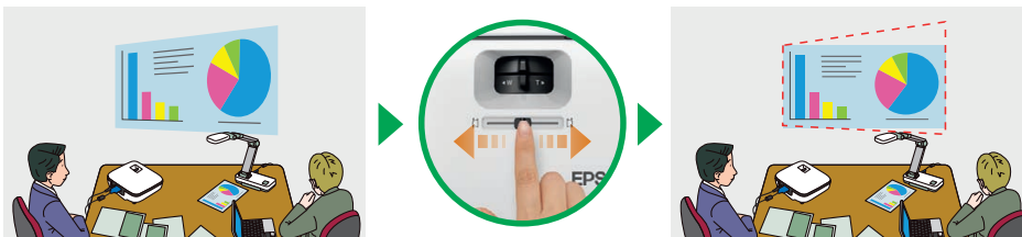
Schieberegler am Gerät für die horizontale Trapezkorrektur: Mit diesem intuitiv zu bedienenden Schieberegler können Sie das projizierte Bild ausrichten, falls der Projektor in einem schrägen Winkel zur Projektionsfläche aufgestellt ist.